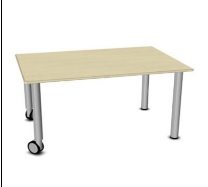
Tisch mit Rollen