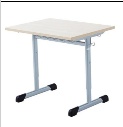
Einzeltisch, höhenverstellbar, abklappbar