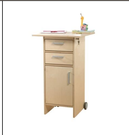
Steh- und Rolltisch