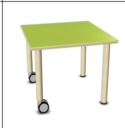
Einzeltisch mit Rollen